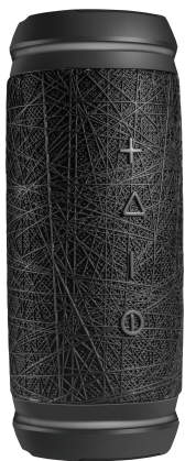
Caixa de Som Stereo Portátil